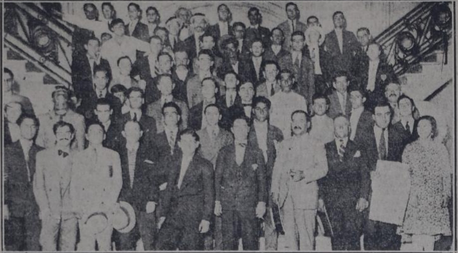
GRUPO DE CIUDADANOS QUE, DESPUES DEL ACTO EN JUJUY Y RIVADAVIA, LLEGO A NUESTRO diario para expresar su protesta por la actitud policial.

Terminados los actos, los vecinos organizaron varias columnas que recorrieron algunas cuadras en medio de un gran entusiasmo, vivando al Partido Socialista y a sus representantes en la comuna por el celo con que supieron defender los intereses del vecindario.