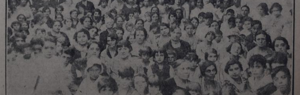
PARTE DE LA NUMEROSA CONCURRENCIA QUE ASISTIO AYER AL HERMOSO FESTIVAL INFANTIL organizado por la Agrupación Femenina "Vida Nueva", sección 15a., Villa Mitre, en su local social Nazca 1681. El excelente programa preparado se desarrolló en todas sus partes con calurosos aplausos del auditorio, que premió la destacada actuación de los pequeños intérpretes y la inteligente dedicación de las maestras.